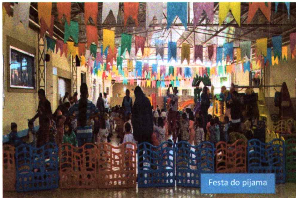
Festa do pijama