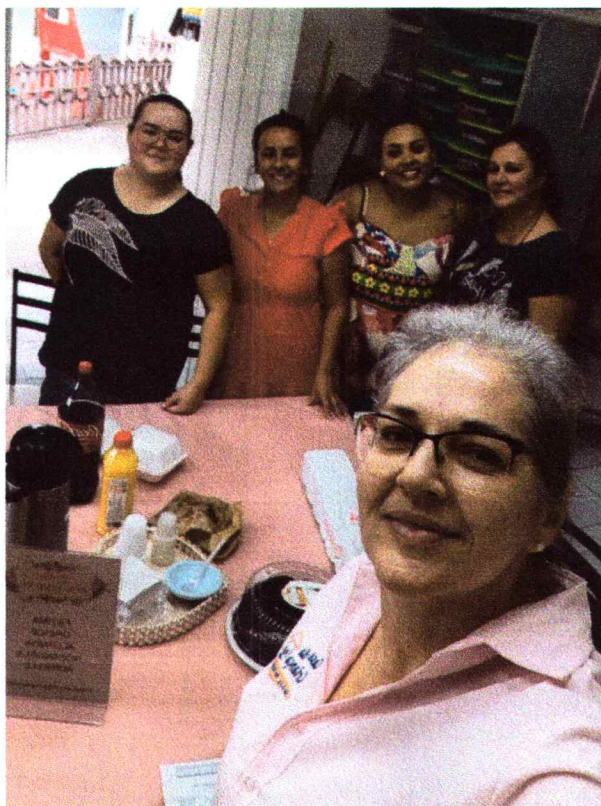
Reunião de equipe