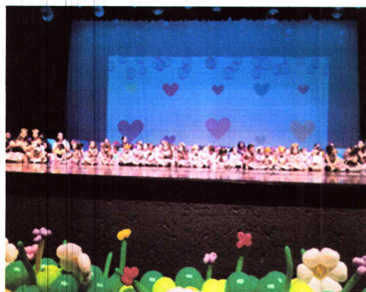
Dinâmica com a família na formatura (uma orquestra com folha de sulfite)