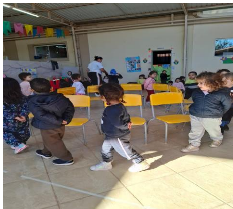
Atividade 1: Conviver

O descritivo de todas as atividades desenvolvidas no mês encontra-se no planejamento, arquivado na Unidade, e disponível para consulta.