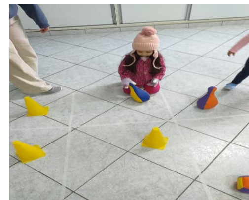
Atividade 5: Conhecer