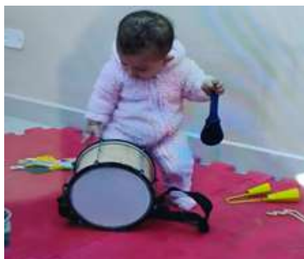
Atividade 5: Escolha de instrumentos musicais- bandinha