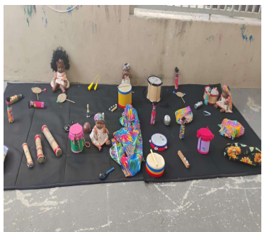
Atividade 1: Espaço organizado aprendendo sobre a cultura africana