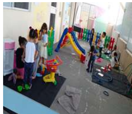
Atividade 7: Cantinho de vivência a livre escolha