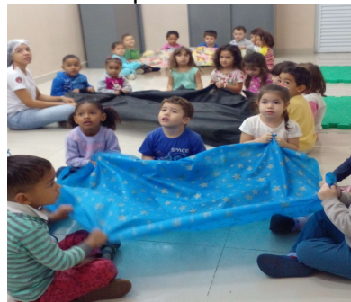
Atividade 7: Trabalho em grupo: panobol