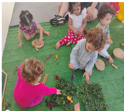
Atividade 2: Contexto investigativo território dos dinossauros