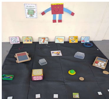
Atividade 2: Forma geométrica quadrado