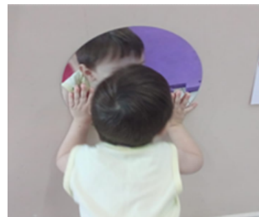
Atividade 7: Identidade e autonomia- Reconhecimento de si mesmo