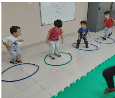
Atividade 6: Circuito com bambolê