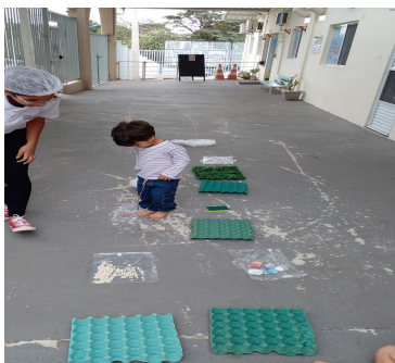
Atividade 5: Sustentabilidade- Atividades realizadas com materiais reciclados