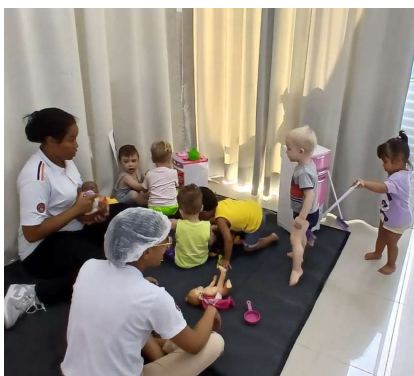
Atividade 1: Cantinho de livre escolha com tarefas do cotidiano