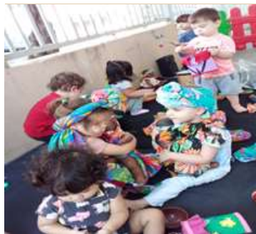
Atividade 6: Habitar e pertencer- Cultura africana;