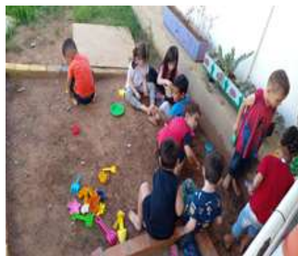
Atividade 6: Brincadeira livre no tanque de terra