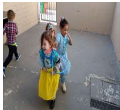
Atividade 3: Desfile de fantasias oportunizando a escolha