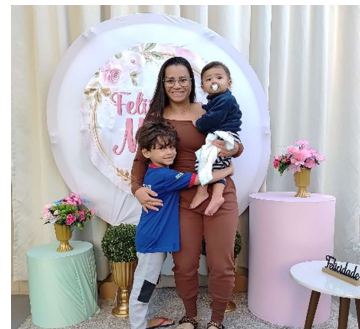
Atividade 7: Datas comemorativas: Dia das mães