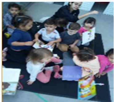
Atividade 4: Expressar