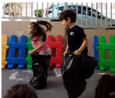
Atividade 5: Corrida de saco